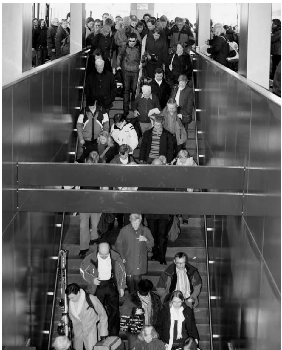
La stazione di Visp in un sabato di febbraio: centinaia di vacanzieri provenienti dai treni a due piani che hanno percorso la linea di base del Lötschberg devono armarsi di pazienza per cambiare treno. Un esempio delle necessità dei trasporti pubblici di disporre di infrastrutture adeguate.

dirottamento della parte dei cantoni della tassa sul traffico pesante), un prefinanziamento, partecipazione dell'economia privata o un contributo degli utenti. Quest'ultima non è la variante preferita da Moritz Leuenberger, come ha precisato alla trasmissione della DRS «Samstag-Rundschau» del 20 dicembre. Nella fissazione delle tariffe occorre procedere con la massima prudenza, per evitare che il prezzo del biglietto spinga la gente a tornare all'automobile.